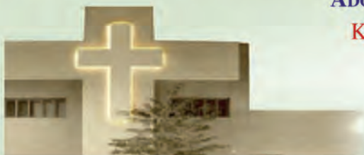
Jejuicki Ośrodek Milenijny

W pierwszy piątek miesiąca - od 17:30 do 19:30